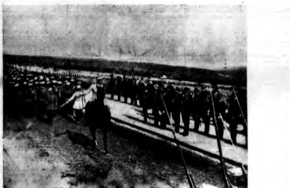
Zdjęcie przedstawia fragment defilady manewrujących oddziałów francuskich przed Nacelnym Wodzem Wojsk Polskich gen. Rydzem - Smigłym w towarzystwie gen. Gamelin, przed cmentarzem poległych w Douaumont.