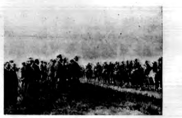
Zdjęcie przedstawia moment defilady kawalerii francuskiej na terenie obozu manewrowego Sulpes w niedalekiej odległości od Chalon sur Marne.