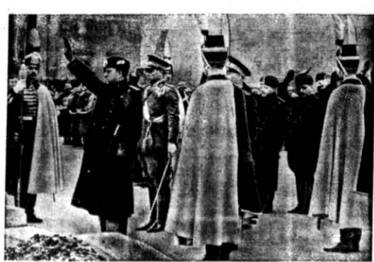
Włoki minister spraw zagranicznych by...