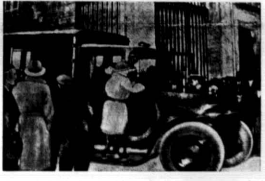
Transportowanie rannych po wybuchu w podziemnej fabryce prochu w Saint Chamme, w pobliżu Marsylii, gdzie wydarzył się strasliwa katastrofa. Dotychczas zainicjowano 40 zabitych i 200 rannych.