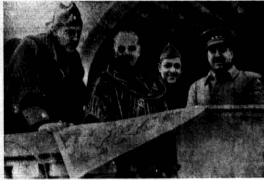
General Varela (bez czapki) komendant oddziałów niecierpiących na Madryt.