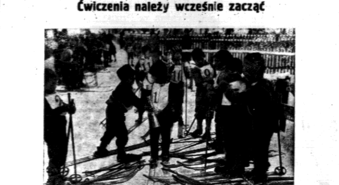
Najleńdziej wyprowadzają się na pierwszy wyścig.