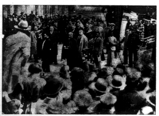
Zdjęcie nasze przedstawia przejazd cesarza Abisynji... Negus w Londynie...