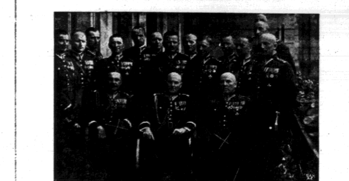
W dniu wczorajszym przedstawiciele dywizjonu... Artylerzyści u gen. Rydza Śmigłego...