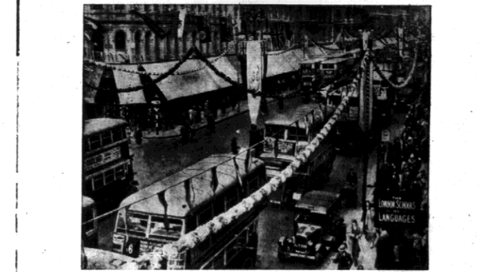
Pozostawiamy czytelnikom znaną Europę... Miasto w girlandach...