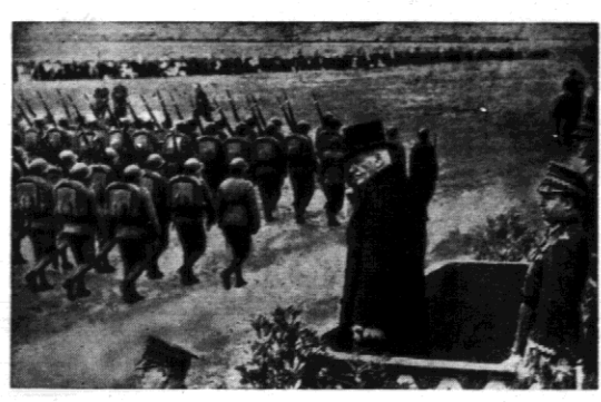
Z okazji uroczystości 10-letniego jubileuszu... Pan Prezydent Rzeczypospolitej...