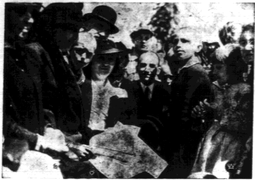
W uroczystości poświęcenia nowego ośrodka zdrowia i ogródka Jordanowskiego w Warszawie, wzięli udział obok przedstawicieli Rządu p. Prezydentowa Marja Mościcka oraz przewodnicząca Komitetu Opieki p. Marszałkowa Aleksandra Piłsudska.