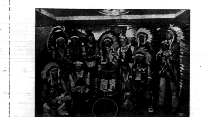
Zdjęcie nasze przedstawia grupę Amerykanów... Z życia M.-S. „Płsudski”...