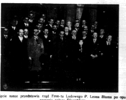
Zdjęcie nasze przedstawia rząd Frontu Ludowego p. Leona Bluma po opuszczeniu pałacu Elizejskiego.