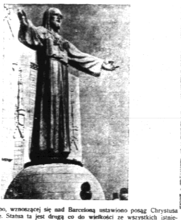
Na górze Tibidabo, wznoszącej się nad Barceloną ustawiono posąg Chrystusa odlany w brązie. Statua ta jest drugą co do wielkości ze wszystkich istniejących pomników Chrystusa.