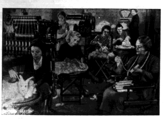
Zawody tego rodzaju urządziła jedna z fabryk... Walka o rekord w strzyżeniu...