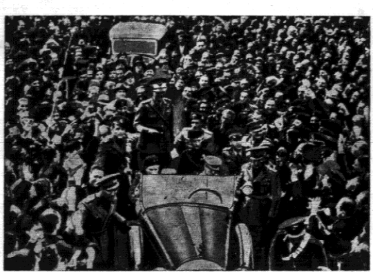
Przejazd marszałka Badoglio przez Rzym... Rzym wita zwycięskiego marszałka...