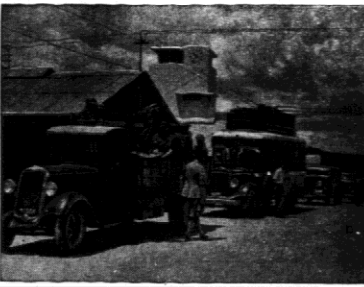
By napobierz napędem Arabów w Palestynie towarzyszy każdemu angielskiemu transportowi samochodowy ciężarowy z żołnierzami angielskimi.