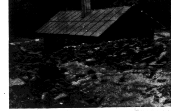
W pobliżu wsi Francji rozstali się przelotowa burza, że kamienie rzuciły na przelotną, zasypały domy, jak to widzimy na zdjęciu.