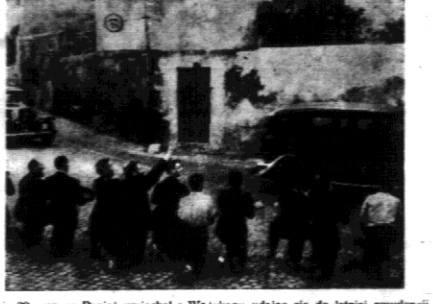
Dnia 30 czerwca Papiież wyjechał z Watykanu udając się do letniej rezydencji Castiglionello...