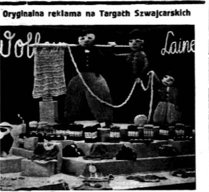
W czasie szwajcarskich Targów Próbek zorganizowanych w roku bieżącym, powszechną uwagę zwracało niezwykle pomysłowe reklamowe stoisko przemysłu wełnianego. Kulekiki bardzo udane stanowiły najlepszą reklamę dla poszczególnych gatunków wełny.

Dystrykt służby brzozejowej w U. S. A. zdecydowała się na sprzedaż na szmiele sporej liczby latarni morskich, jako przestarzałych już i niezdających się do użytku. Wobec tego, że w Warszawie nie ma już pieniędzy, nie mogą oni wyjechać.