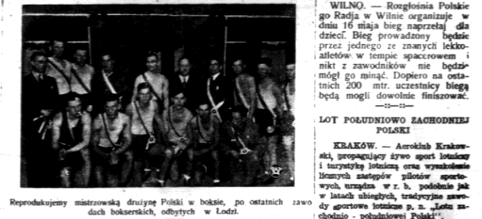
Reprodukcję mistrzowską drużyny Polski w boksie, po ostatnich zawodach bokserskich, odbytych w Łodzi.