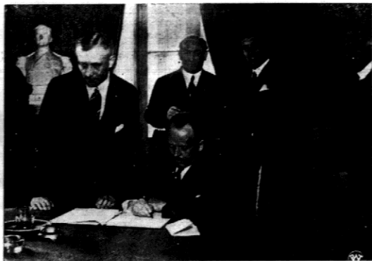
Ongodaj p. premier Kościelkowski pod pisał trzy umowy między Polską a Węgrami. Na zdjęciu — chwila składania podpisu przez premiera Kościelkowskiego. W tle stoi premier węgierski — Gombos.