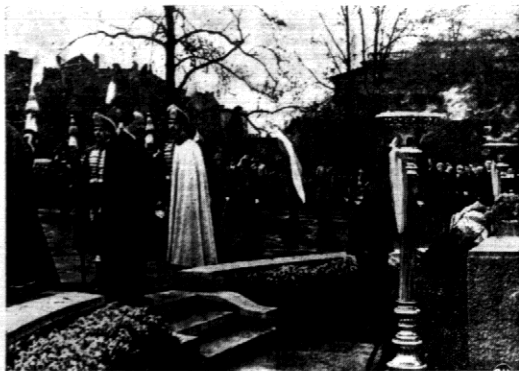
W pierwszym dniu pobytu w stolicy Węgier — premier Kościelkowski złożył wieńce na grobie Nieznanego Żołnierza. Ceremonia ta odbyła się niezwykłe uroczyste. Na ilustracji widzimy premiera Kościelkowskiego