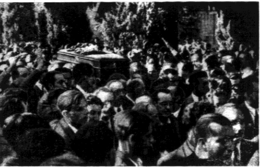
Wśród tłumnego udziału monarchistów odbył się w Madrycie pogrzeb przywódcy hiszpańskiej Falvy Sotelo.