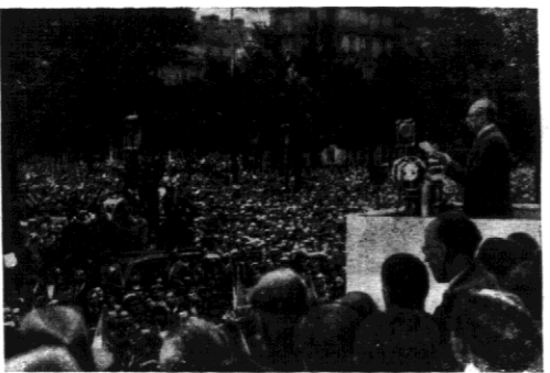
W dniu Święta Narodowego urządził „Front Ludowy” we Francji wielką demonstrację na Placu Bastylii. Prezydent ministrów Blum wygłosił przy tej okazji mowę, transmitowaną przez radio.