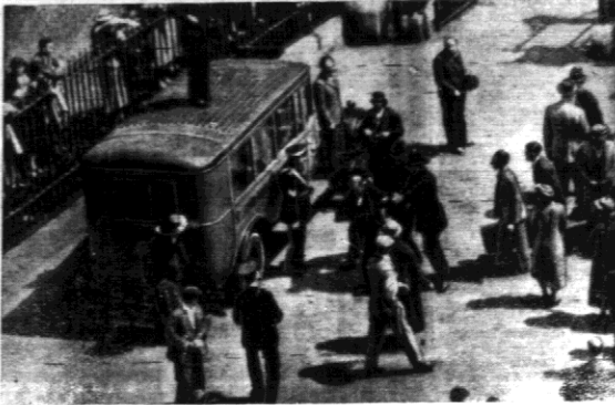
Policjanci odprowadzają do samochodu, sprawcę rzekomego zamachu.