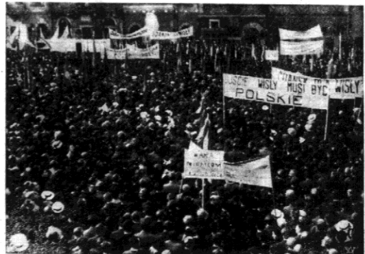
Po kilku przemówieniach uchwalono rezolucje domagające się powiększenia i utrwalenia polskiego stanu posiadania w Gdańsku, oraz stwierdzające, że każda rewizja statutu Wolnego Miasta może pójść tył ko po linii rozszerzenia polskich uprawnień w Gdańsku. Poczem uformował się obywatelski pochód z transparentami, który przeszedł ulicami Warszawy do ulicy Kłopotaj.