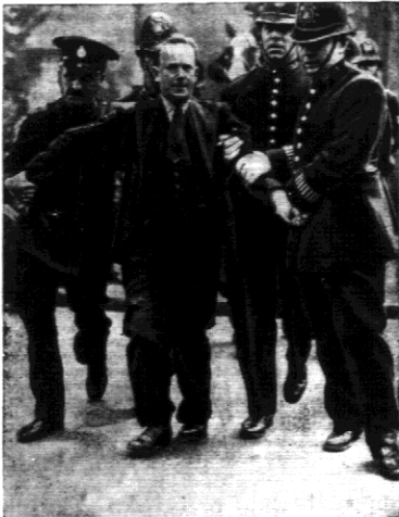
ZAMACHOWIE NA KRÓLA ANŻELSKIEGO