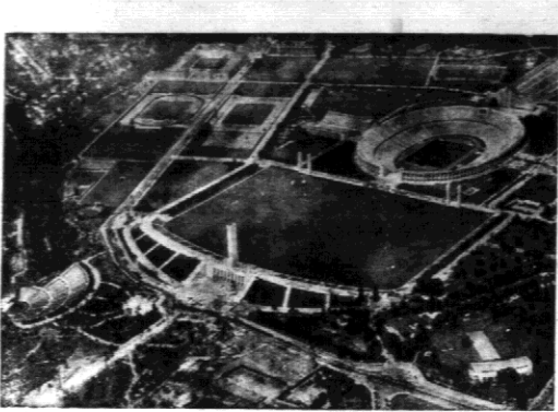
W związku z zbliżającym się terminem rozpoczęcia Olimpiady berlińskiej, reproduujemy widok ogólny pola sportowego Rzeszy Niemieckiej...