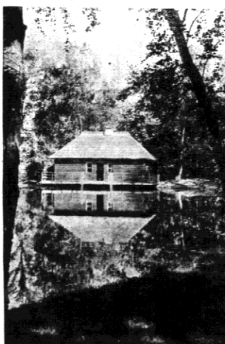
Dom kąpielowy dla Finów w wsi Olimpijskiej Dąberitz.