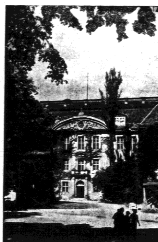
Zamek Koepenick, jedna z siedzib przeznaczonych dla olimpijskich zyci