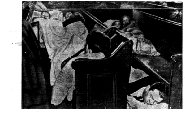
Ofiary powodzi w Stanach Zjednoczonych znalazły chwilowy przytułek w szkołach, budynkach urzędów i nawet kościołach. Na zdjęciu ofiary powodzi w kościele w Pittsburgu.