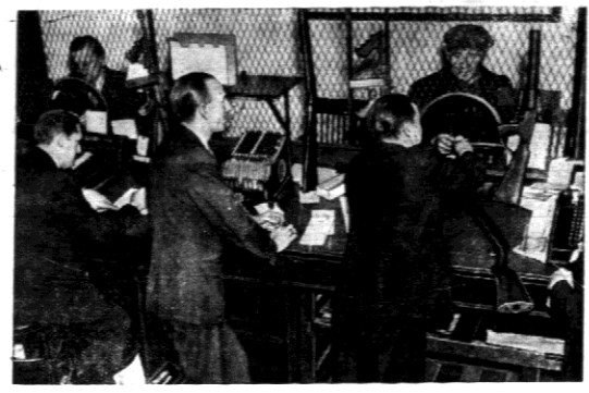
W Ameryce zaopatrzone okienko urzędów podatkowych w szybkoobrotowej kabinie maszynowej