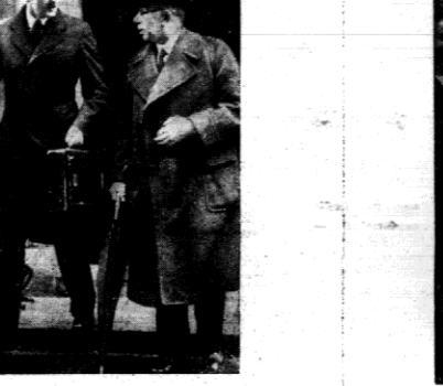
Minister spraw zagranicznych Eden i minister J. H. Thomas...