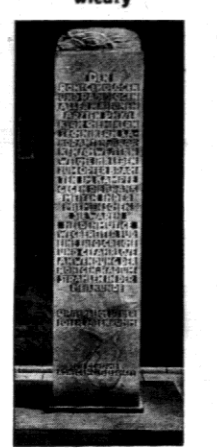
W Hamburgu odsłonięty zostanie w tych dniach pomnik dla uczczenia ślaskich roentgenologów, fizyków i chemików