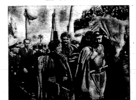
Konkord pogrzebowe za śmierciennymi szoskami Wenecjosi, przywiezione z Francji na Krotę posuwał się w portu Kandyja na poszerzeniu 10 km. do klasztoru św. Elżbiety w Akrotiri.