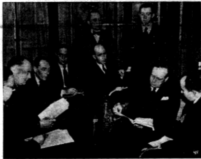
Nadzwyczajny ambasador kanclerza Hitlera von Ribbentrop wręczył jak wiadomo w Londynie, nowe warunki pokojowe Niemiec, oczekiwane z dużym napięciem przez całą opinię poli tyczną Europy.