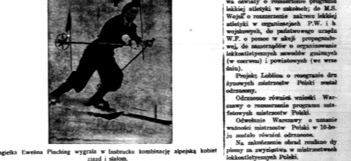
Angielka Ewelina Finching wygrała w Innsbrucku kombinację alpejską kobiet zjazd i sialom.