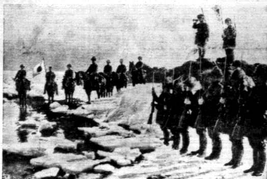
Na granicy mandżursko-mongolskiej doszło do krwawych starć między oddziałami sowieckimi i japońskimi — mandżurkami.