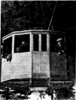
Już został uruchomiony wagonik, przewożący turystów na Kasprov Wierch.