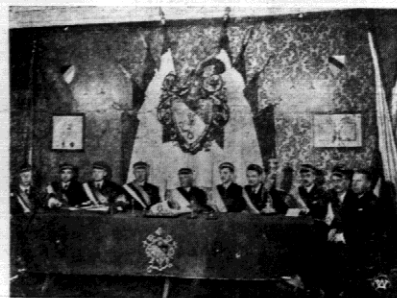
W Warszawie odbyła się piękna uroczystość zawarcia uroczystego aktu przyjaźni pomiędzy jedną z najbardziej zasłużonych korporacji polskich Wlecia, a estońską korporacją Vironia. Hasłami obu tych stowarzyszeń akademickich przeplatały się ze sobą, gdyż obydwoje powstały równocześnie w Rydze przed 50 laty, obie należały do tego samego związku i obie — grupowały ten sam element młodzieży Fragment tej pięknej uroczystości podaje nasze zdjęcie.