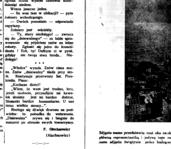
Złotopie osmo przedstawiła razi oka na sławną katedrę w Antwerpii...