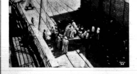
Zdjęcie przedstawia moment przenoszenia trumny ze zwłokami ś.p. konsula Łukasiewicza...