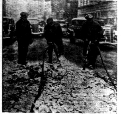
Gdy na ulicach New Yorku robotnicy rąbią lód, na Florydzie panie używają kąpiel słońcnych.