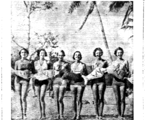
Gdy na ulicach New Yorku robotnicy rąbią lód, na Florydzie panie używają kąpiel słońcnych.