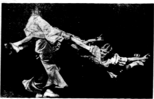
Mistrzowskie trio Veronas, popisujące się na wrotkach.