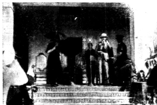
W stolicy Indji otwarto nowy port lotniczy. Na zdjęciu wicekról Indji lord Willingdon