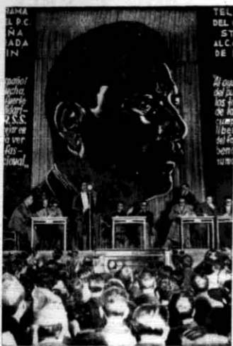
Na zebraniu propagacji w Madrycie.