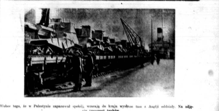
Wobec tego, że w Palestynie zaplanował spokój, wracając do kraju wysłano tam z Anglii oddziały. Na zdjęciu transport tanków.

Według wiadomości z dobrze poinformowanych źródeł, dowódtwo wojsk rządowych podejmuje obecnie gwałtowne ataki przy użyciu wszystkich środków, będących w jego dyspozycji, aby by ustuliwić ostnawcze otoczenie stolicy. Wojska powstańcze silytko bez większych trudności odparły te ataki, lecz posiadają się naprad.