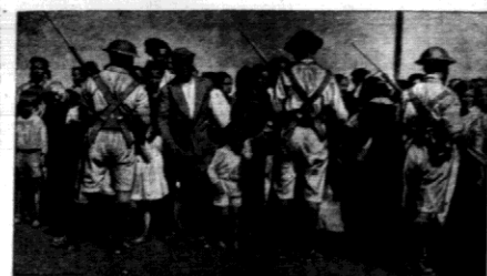
Anglia zamknęła swą granicę od Strony Hiszpanji, aby nie wpuszczać uchodźców hiszpańskich do Gibraltaru.