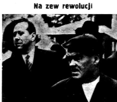
Władz katolickiej prasy hiszpańskiej Gil Robles, hawaryj po emigracji z kraju w Biarritz, został zamieszany przez francuskie władze do opuszczenia tej miejscowości, a to w związku z kontaktem się z rewojnucyjnymi. Na zdjęciu widzimy Gil Roblesa w Hajonnie.