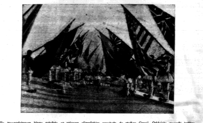
Po trzygodzinnym biegu sztafeta ze zniczem olimpijskim przybyła do stołicy Grecji. Oddział gwardii królewskiej uczynił szpaler, trzymając chorągwie tych narodowości, które weźną udział w igrzyskach.