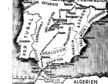
Mapka działań wojennych wojsk powstających w Hiszpanji.