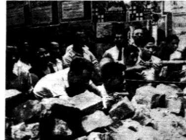
Reproduujemy dwa charakterystyczne zdjęcia z obecnego rewolucyjnego wojny w Hiszpanji.