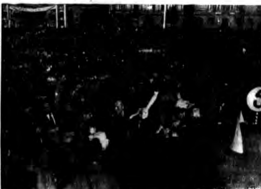
Witano żołnierzy — serdecznie, wznosząc okrzyki „niech żyje armia, niech żyje żołnierzy”. Na zdjęciu — moment rozdawania żołnierzom paszek żywnościowych przez członków komitetu powitania żołnierzy.