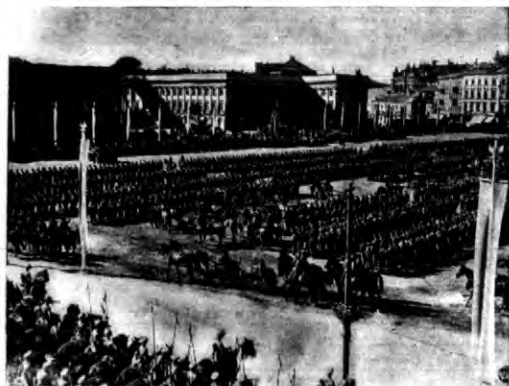
Onegdaj stolica witała uroczystie, a zarazem serdecznie, powracające z 6-tygodniowych ćwiczeń oddziały wojskowe garnizonu warszawskiego.