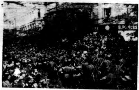
Fragment uroczystego i serdecznego powitania na ulicach Bydgoszczy węg.