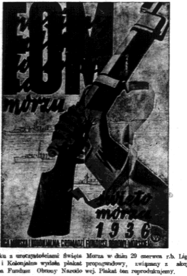
W związku z uroczystościami Święta Morza w dniu 29 czerwca r. b. Liga Morska i Kółka młodych wzięły udział w propagandzie, związanej z akcją obywateli na Fundusz Obrony Narodowej. Plakat ten rozprowadzają.