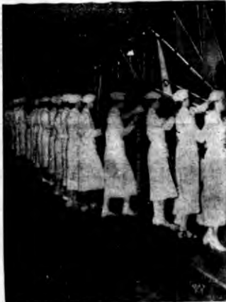
Złajcie przedstawia moment finałowy grup dziewcząt w białe mundurki pomoczących reprezentacji olimpijskiej gólkami wawarskiej.