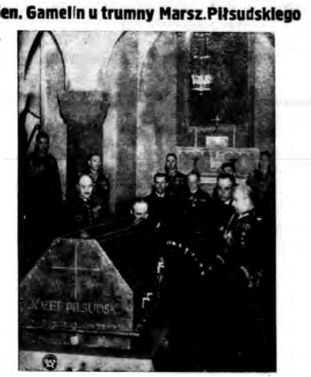
Gen. Gamelin u trumny Marsz. Piłsudskiego

Ważnym jest zapamiętać nieuczniom. Wyszaryżycy przebie ustalanie powoływanych komisji, jako koniecznego wynagrodzenia wysłuchał aprobaty.