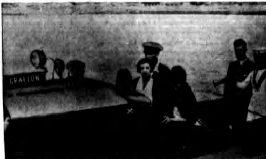
Król argielski Edward VIII urządził od czasu wycieczki po Jugostawji, w której obecnie bawi. Na zdjęciu widzimy go w motorówce.