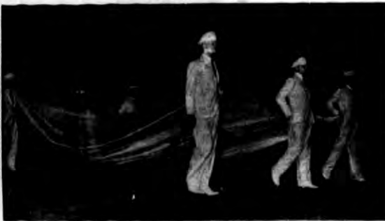
Standar olimpijski odniesiony został do trybuny honorowej przez 5-ciu biało ubranych technistrzów.