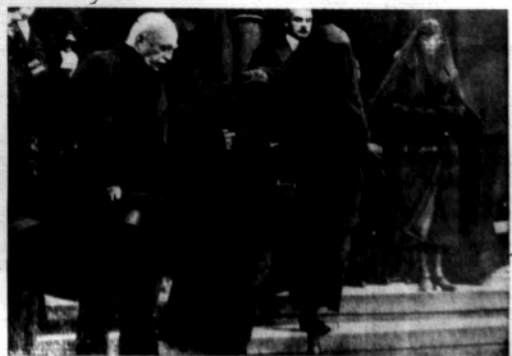
Rodzina bliskiej opasała kociel.