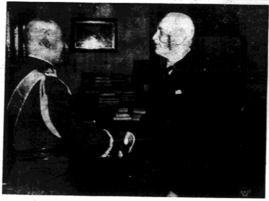
W dniu uroczystego jubileuszu 10-lecia urzędowania P. Prezydenta Rzeczypospolitej prof. dr. Ignacego Mościckiego, złożył Dostojnemu Jubilatowi życzenia Generalny Inspektor Sił Zbrojnych gen. dyw. Rydz-Śmigły