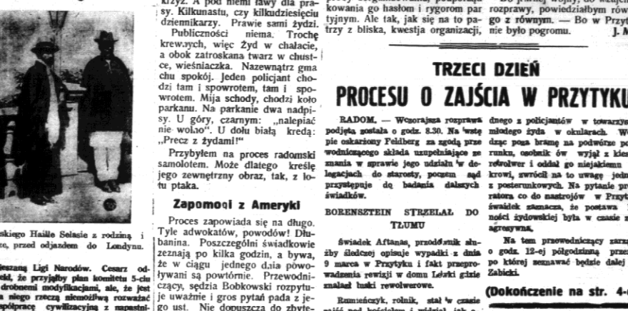
Zdjęcie z procesu...