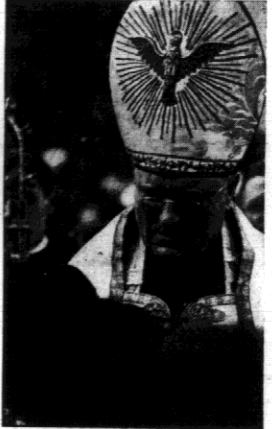
Zdjęcie nasze przedstawia podobiznę J. E. ks. kardynała Kakowskiego.