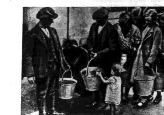
W okolicy Epworth w pobliżu Doncaster...