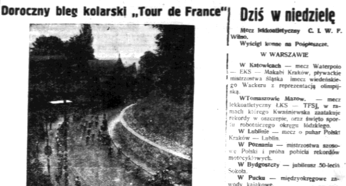
Zdjęcie nasze przedstawia fragment pierwszego etapu Paryż - Lille, biegu kolarskiego „Tour de France”.