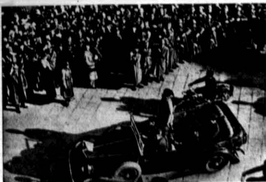
Medjolan zgotował Mussolinimu owacyjne przyjęcie. Duce wygłosił wielką programową mowę, która jak się domo w innych krajach Europy wywołała wielkie poruszenie.