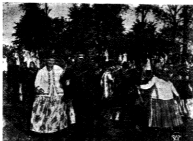
Tradycyjny taniec śląski tańczony zresztą mietyko na weselach — „Tropak”

ZBYTECZNE SA wszystkie mocne słowa oraz superlatywy. KORONA produkcji Europejskiej wg. nieśmiertelnej powieści Piotra Benoit z znakomitą artystką filmową Ellsq LANDL.