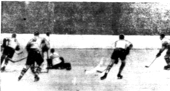
Moment spotkania Kanada — Austrija wygrana przez ostatnią 2:1. Zdjęcie pod bramką austriacką.