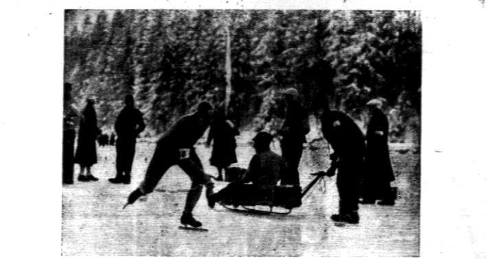
Norweg Baliangrud zdobył dwa złote medale olimpijskie w jedzie szybkiej na 500 m. 5000 m.). Na 1500 m. zdyktował go o sekundę rodak Matheson.