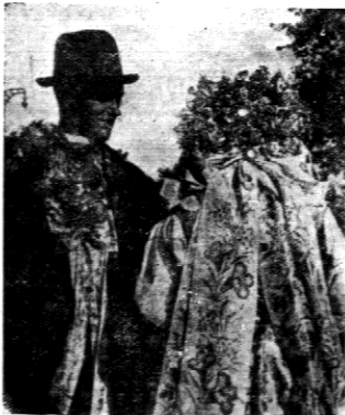
Drużba o drużna.