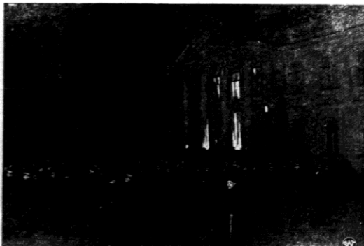
Złapcie nasze przedstawia moment belin, składanego przez korpus oficerski pod Belwedera.