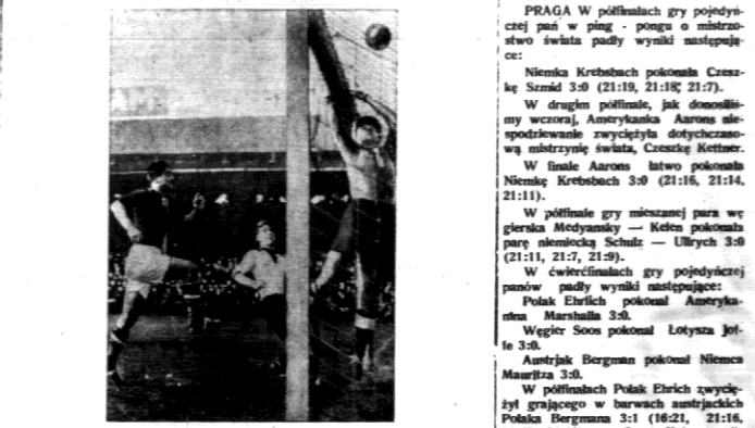
Moment z międzynarodowego spotkania piłkarskiego Niemcy - Węgry w Budapeszcie...