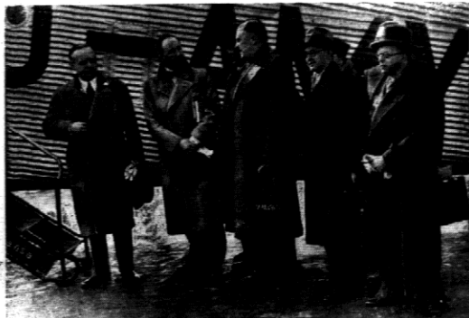
Pod przewodnictwem ambasadora v. Ribbentropa, ułuda się delegacja niemiecka samolotem do Londynu.