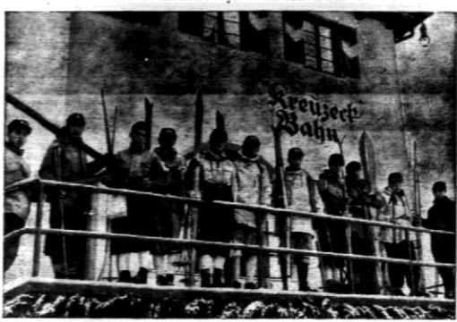
Japońska drużyna narciarska, przybyła do Garniskich Parkienkiern.