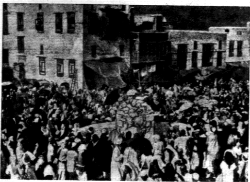
Wobec tysięcy pielgrzymów śpiących w miejscowości Mekki, postanowiono miasto zmodernizować, by stworzyć w nim bardziej higieniczne warunki. W pierwszym rzędzie projektowana jest budowa elektrowni.