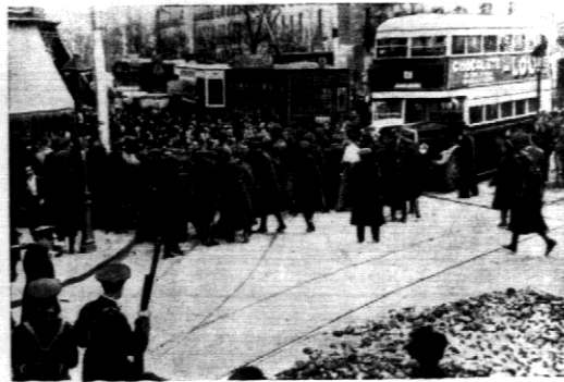
Pod sztandarem partji lewicowych w wyborach hiszpańskich doszło w wielu miastach do zaburzeń i rozruchów.