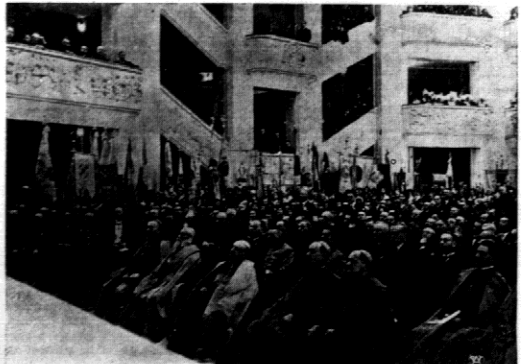
Widok ogólny sali podczas uroczystości otwarcia Domu Katolickiego. W pierwszym rzędzie — przedstawiciele wyższego duchowieństwa.