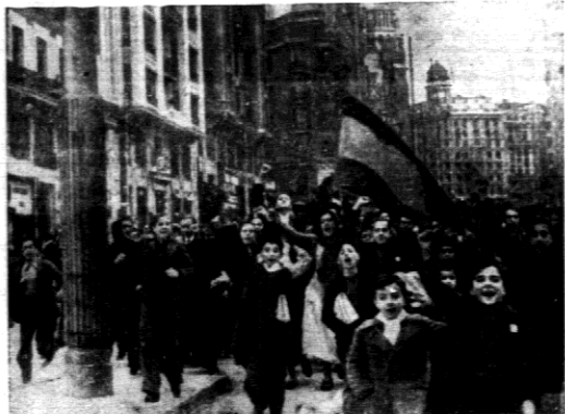
Na zdjęciu demonstracja w Madrycie.