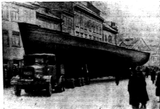
W Konstancji mieszkańcy mieli oglądać nieswykły widok. Na specjalnym podwoziu wieszono przez ulicę statek motorowy.