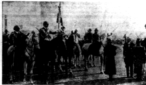
Bardeo uroczyste poświęcono w Raymie nowy sztandar 13 p. artylerji, u dzielen księżniczki Marji Sabaudzkiej