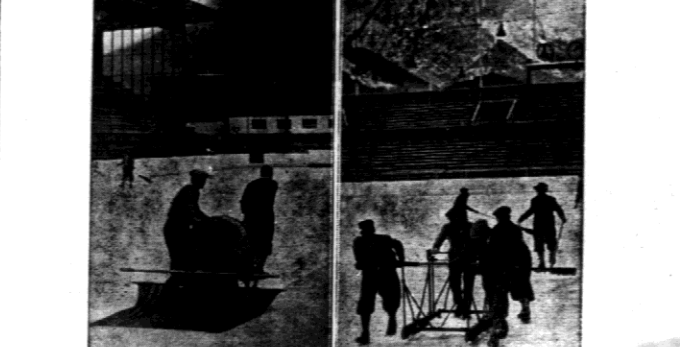
Maszyny do ulepszenia stanu łożu w Garnusku Partenkiehrem.