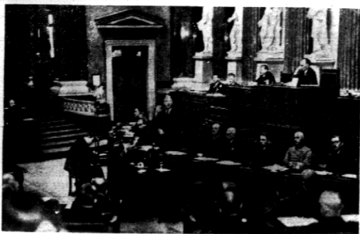
1 kwietnia odbyło się posiedzenie parlamentu związkowego w Austrii, na którym uchwalono wprowadzenie powszechnej służby wojskowej.