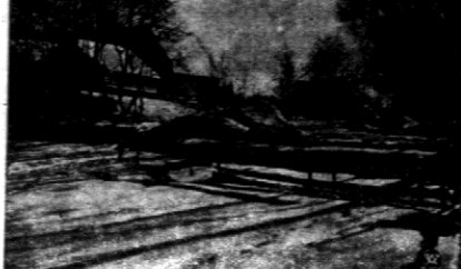
W Zakopanem widać śnieg, który przetrwał z poprzednich zim.