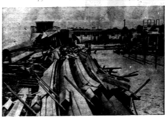
Polozono nad ożrozem płytami zamienia się w stos szałoz.