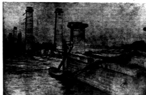
Napór fal wehrskiej Loary spowodował zupełne zniszczenie mostu w Mon tjean.