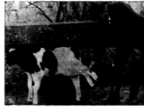
Kolo Hamburga urodzilo się cieję o pięciu nogach, pozatem normalna i zdrowa.