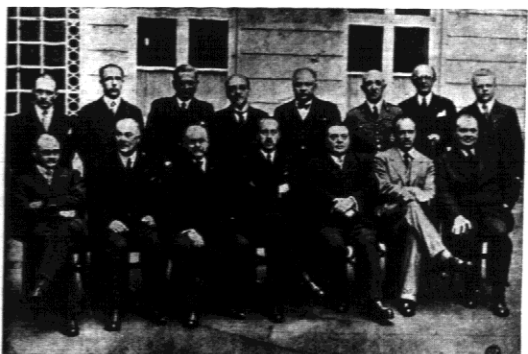
Zdjęcie nowego rządu belgijskiego z premierem van Zeelandem...