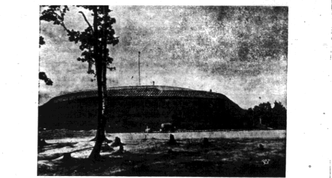
Zdjęcie nasze przedstawia obecny stan robot budowlanych Kopa ku czci Marszałka Józefa Piłsudskiego na Sowińcu pod Krakowem.