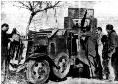
Oficerowie hiszpańscy wojsk powstańczych przy zdołaniu sówieckim samochodzie pancernym.