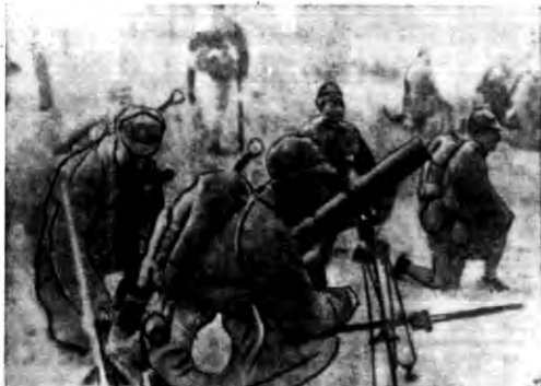
Zdjęcie nasze przedstawia pozycje wojsk rządowych pod Szia Fu.