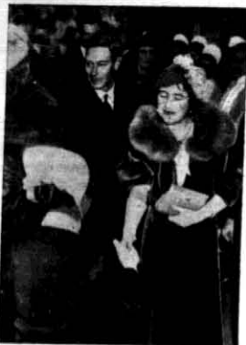
Książę i księżna Yorku bawili ostatnio w Cøldge - Hospital w Denmark.