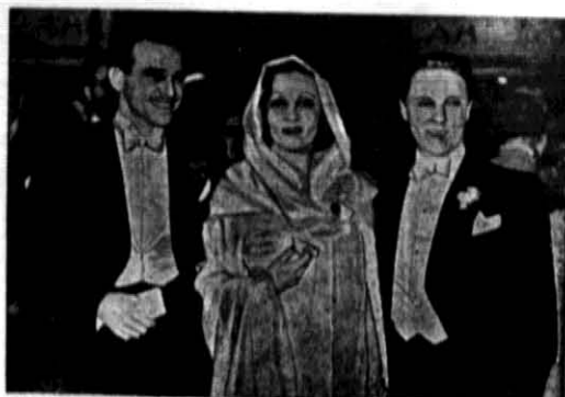
Marlena Dietrich z mężem (na prawo) i Douglasem Fairbanksem, po premierze filmu „Rembrandt” w Londynie.