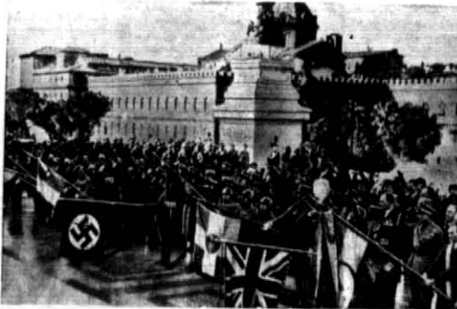
W Rzymie odbył się zjazd kombatantów. Na zdjęciu składanie wieńca przez delegację na grobie Nieznanego Żołnierza.