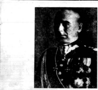
Myśli Mocarstwa nie będzie się wlokła w ogonku skwapliwych hotełów...