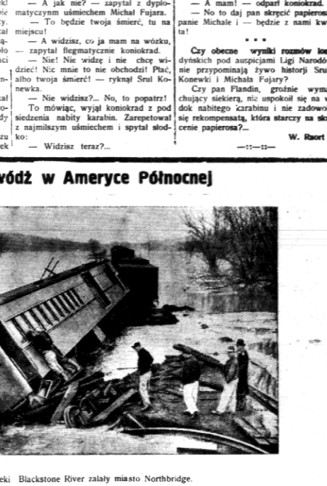
Fale rzeki Blackstone River zalały miasto Northbridge.