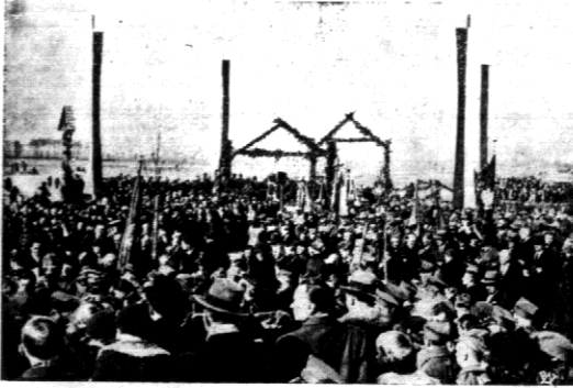
Widok ogólny uroczystości na placu Olszynki Grochowskiej w miejscu, gdzie stanie pomnik mauzoleum ku czci poległych bohaterów.