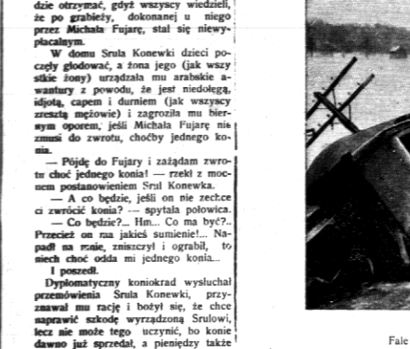
Fale rzeki Blackstone River zalały miasto Northbridge.