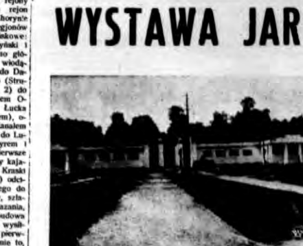
Na zdjęciu naszym reprodukcji (temu Jarmarku Poleskiego w Piaseku z pawilonem głównym. Jarmark ten, który odtworza w przekroju obły...