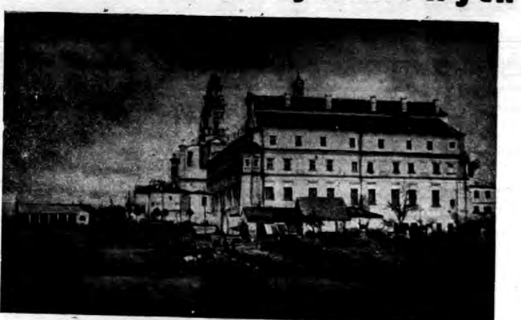
KOLEJAJATA JEZUICKA W PIŃSKU

Wynikają stąd dla rolnictwa i w. Wynikają stąd dla rolnictwa i w. Wynikają stąd dla rolnictwa i w. Wynikają stąd dla rolnictwa i w.