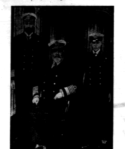
Obecny król angielski, ówczesny książę Walji, wraz ze swym ojcem królem Jerzym V-yim i dwójką Edwardów VIII. Zdjęcie to robione jest w 1909 r.