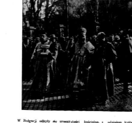
W Bułgarii odbyły się uroczystości kościelne, z udziałem króla i dostojników liter.