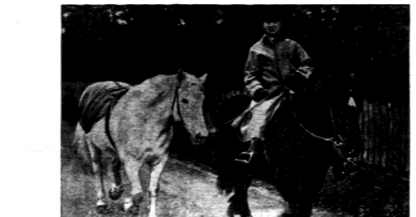
Biały pony, na którym król Jerzy V jeździł ostatnio