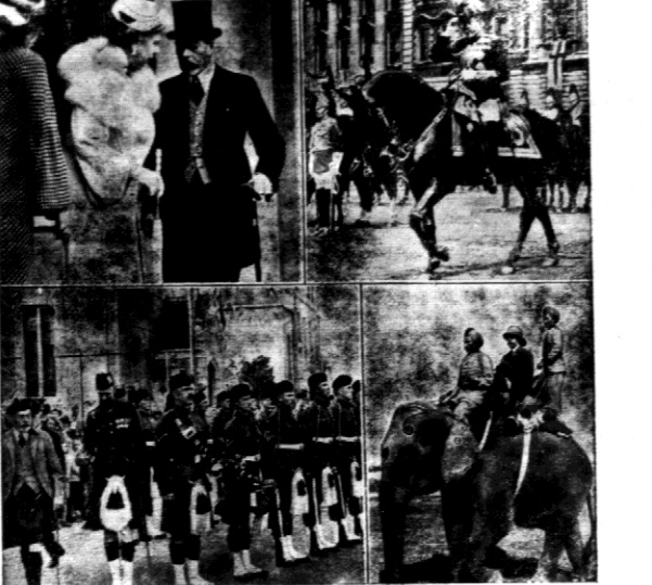
Z życia króla Edwarda VIII