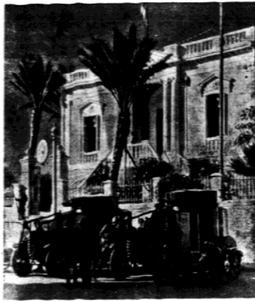
Władza wysp Rhodos sta obecnie wielkie strategiczne znaczenie dla Włoch...