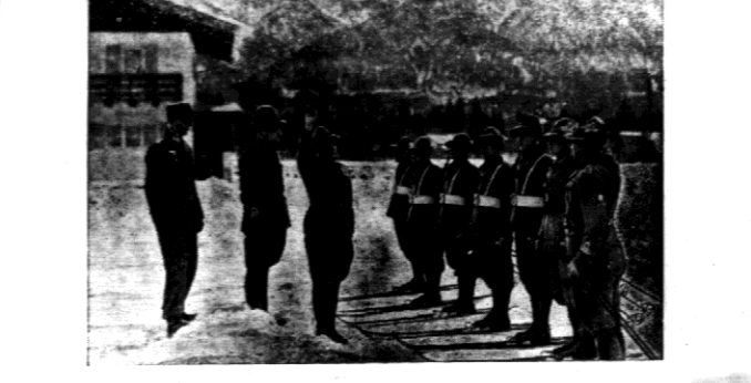
Włoska drużyna wojskowa w Garnimach