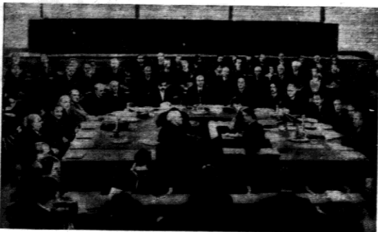
Pierwsze posiedzenie komisji 13-tu w Genewie, w sprawie wojny włosko-abijskiej.