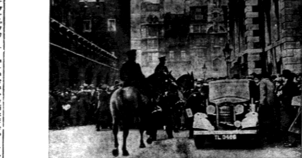
Tym przed pałcem w Buckingham