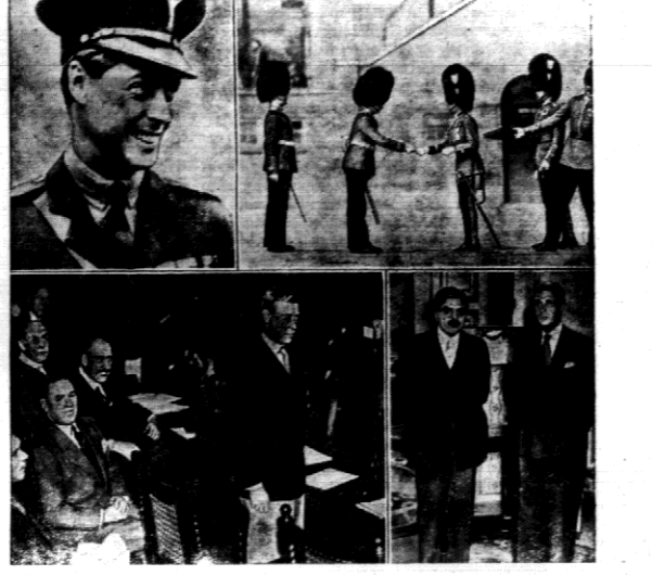
Z życia króla Edwarda VIII