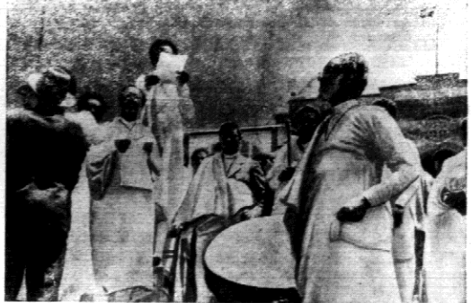
MOBILIZACJA W ABISYNI. Cesarz Abisynji ogłosił ostatnią mo bielizę, która się odbywa wszędzie za pomocą bicia w bębny.