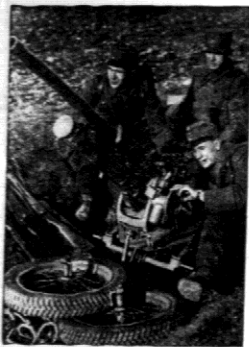
Działo przeciwpancenne na porczy. sfinks z pod Adui