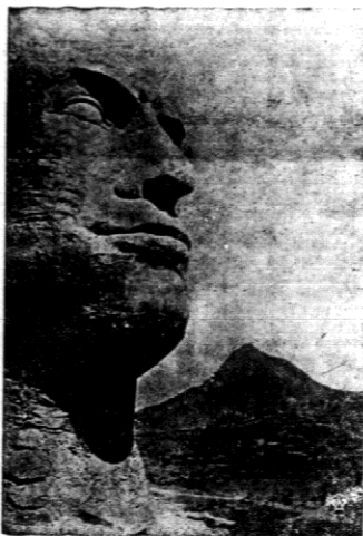
Do upamiętnienia zwycięstwa w roku 1895 pod Adui, gdzie jak wiadomo, w roku 1895 Włoch ponieśli klęskę, w okolicach miasta stłoczono oryginalny monumentalny pamiątkownik. Głowę jego wyrzeźbiono w jednej z skal. Nadnaturalnej wielkości (ponad 4 mtr.) ten pomnik sprawia imponujące wrażenie