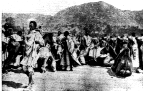
DIEN TARGOWY W MAKALE