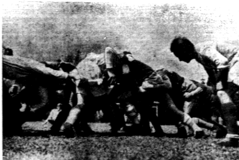
GRĄ, KTÓRA WYMAGA ODWAGI Moment z meczu rugby.

Korona prod. francuskiej 1936 r. Najpotężniejszy film w dziejach kinematografii światowej