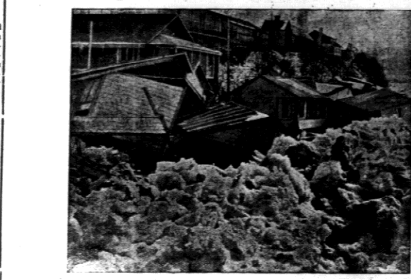
Obrzynie masy lodu zniszczyły domy na wybrzeżu w pobliżu miasta Lewiston, w stanie New York.