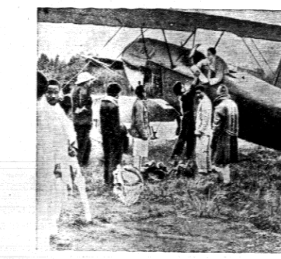
Jedną nowoczesną maszyną samolotową, która mogłaby wziąć udział w walkach powietrznych, spełnia rolę transportu amunicji na front, gdyż przez Włochów zainstalowano wiele ich obrotowych przewagi lotniczej, natychmiast nestralsza.