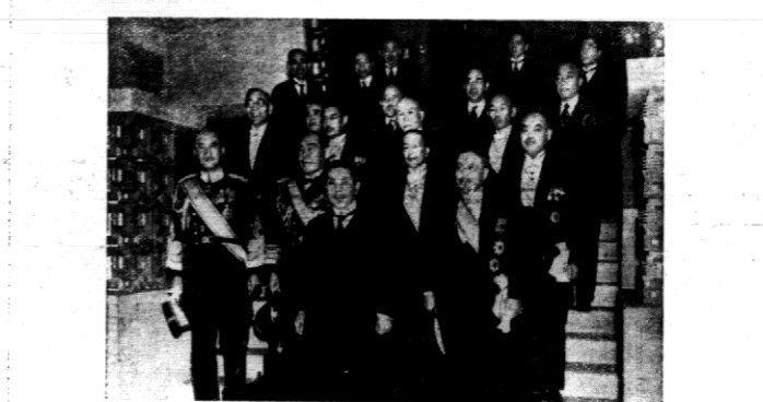
Pierwsze zdjęcie nowoutworzonego gabinetu japońskiego Hiroty. W pierwszym rzędzie minister wojny hr. generał Hirakaru i premier Hirota.