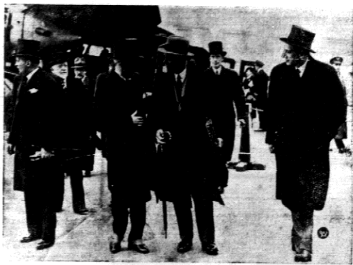
Zdjęcie nasze przedstawia moment powitania min. Halvdana Kohta na lotnisku w Okęcie.