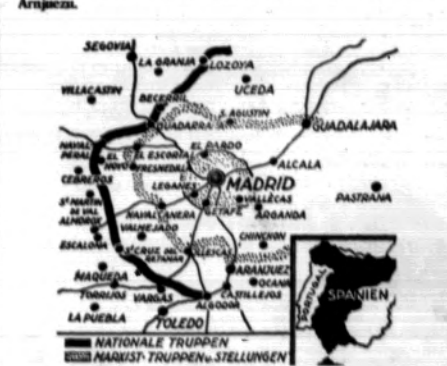
Tak wygląda linja nasierających powstańców, znajdujących się w wielu miejscach nie dalej jak 30 klm. od Madrytu

Przednie stráže gen. Varela, odległe są o 27 klm. od Mad rytu. Oddziały kawalerji pułk. Monasterio osiągnęły linię Panlo ja na Alameca del Sagra i znajdują się w odległości 14 km. od Aranjuez.