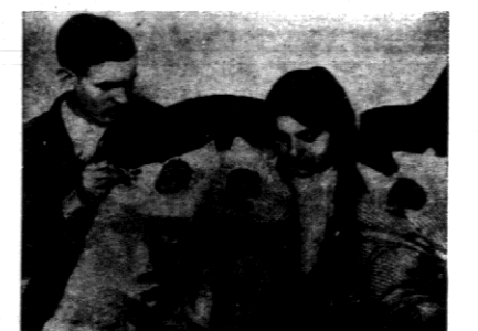
NIETYPIKA RODZINA. Wiedziaczka węgierska urodziła niedawno trojaczki, dwie córeczki i jednego synka. Ale niezwykłość tej rodziny po-lega nie na tem, boć matka ma za-kończe 15 lat, a ojciec 21. Na szczęście matka i dzieci są zupełnie zdrowe.

O gmach dla gimnazjum w Brasławiu BRASŁAW. Otwarte w roku ubiegłym w Brasławiu gimnazjum rozwija się, to też kuratorium otęgu szkolnego ma zamiar w przyszłym roku pozwolić na otwarcie wszystkich czterech klas nowego typu i dwóch ostatnich klas starego typu. W chwili obecnej w Brasławiu odpowiedniego lokalu nie ma. To też Stowarzyszenie w najbliższym okresie budowlanym ma zamiar przystąpić do budowy własnego gmachu. W tym celu wyłoniono specjalny komitet na czele z M. Łukaszewiczem, który rozpracował zabieg o kredyty dla Stowarzyszenia. Obecnie czynione są starania w Dyrekcji Lasów Państwowych w Wilnie o udzielenie długoterminowego kredytu w postaci 500 m. sześć, budulu oraz w Komitecie Funduszu Pracy w Wilnie o udzielenie subydjum w wysokości zł. 15.000.