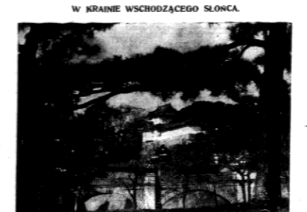
W KRAJNIE WSCHODZĄCEGO SŁONCA Malownicze wejście do pałacu cesarskiego, zwanego w Japonii Most Niebia.