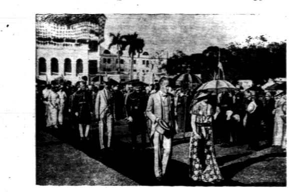
Wicekról Indyi wraz z żoną urzędowali w Kalkucie przyjęcie ogrodowa, na kt. órem było 4000 zaproszonych gości. Żołnierze brytyjscy w marszu przez pustynię egipską na granicę Libji