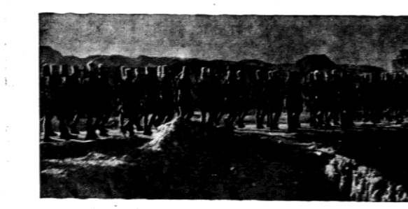
Anglicy — jak wiadomo — ubezpieczą ją staraniem granic między Egiptem a Libją. W związku z tem przesunięto znaczne oddziały na granicę Libji.