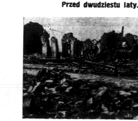
Wiosna nad Somą. Zdjęcie wykonane bezopieczętnie po próbie ofensywy wojsk francuskich i angielskich.