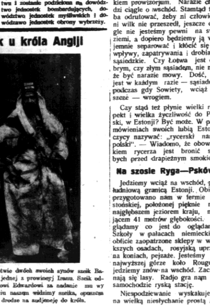
Do Londynu przybył w towarzystwie dwóch swoich synów książę Bahrain, mający swe suwerenne lenno w jednej z prowincji Iranu. Szelk odwołany Londynu, aby podziękować królowi Edwardowi za nadanie mu w znak jego brytyjskiego. Na zdjęciu naszem widzimy szelka, opoznanego z synami hotelu, w drodze na audyencję do króla.