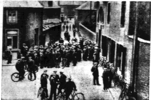
Obrasek ze strajku generalnego górników belgijskich.