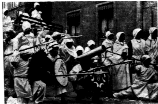
„ABSZYNGYCY”. W wielkim barwnym orszaku karnawałowym w południowo-niemieckim mieście Stuttgart, nie zabrakło między innymi, również i gronie wyglądającej grupy „Abszyngycków”.