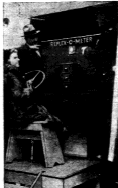
Aparat tego rodzaju ustawiono na ulicy jednego z miast amerykańskich. Na zryw się Reflektometr i rejestruje wszelkie odchyły nerwowej kierowcy.