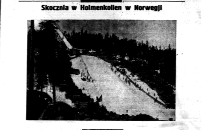
Skocznia w Holmenkollen w Norwegii