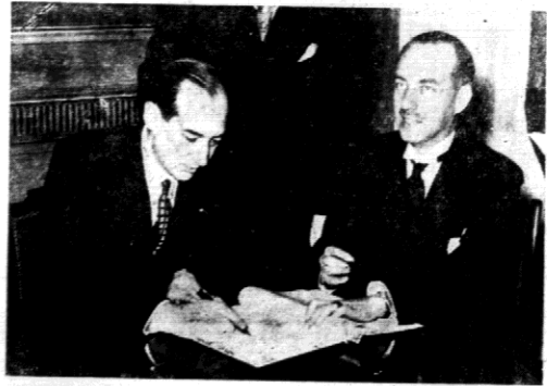
Zdjęcie nasze przedstawia moment składania podpisu na dokumencie przez p. ministra Becka. Obok premier i minister Spraw Zagranicznych Belgii van Zeeland.