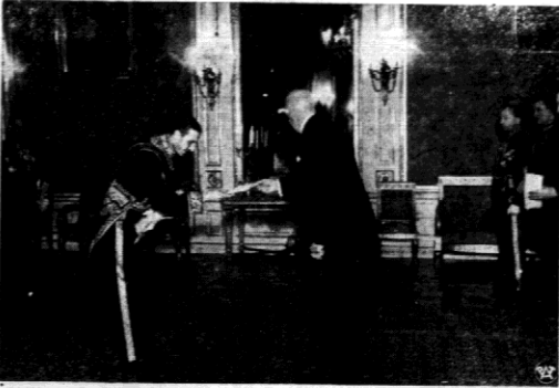
W dniu 3-go marca r. o godz. 19-jej P. Aleksander Paternotte de la Vallée, Poseł Nadzwyczaj. i Minister Pełnomocny Belgii złożył P. Prezydentowi Rzeczypospolitej swe Listy Uwierzytelnijące