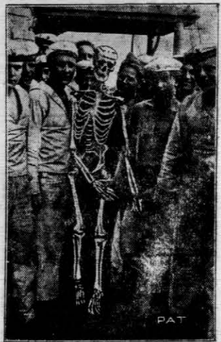
Pod wykładziami anatomii w szkole naszej marynarki wojennej