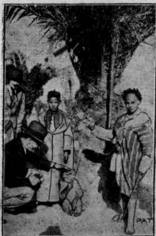
Bandera polska na szlakach świata: oficerowie s/s. Niemien na ulicy w Casablanca (Marokko)