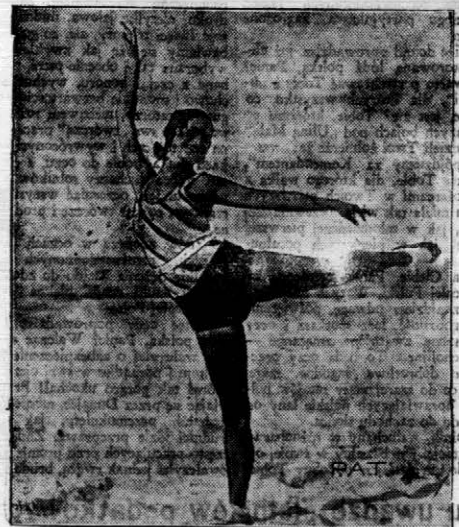
Ćwiczenia po morskiej kąpielii

Gdyby więc narodowa demokracja posiadała władzę i rządziła państwem, Polska przez sojusz z Sowietami stałaby się ślepcem narzędnikiem planów sowiecko-niemieckich na Wschodzie, a to jak widziliśmy wyżej, doprowadziłoby do realizacji wysuwanego przez Niemcy i Sowietów planu nowego rozbioru Polski. Zaślępienie polityczne zaprowadziło narodową demokrację tak daleko, że mimowolnie stała się ona instrumentem pomocniczym dla imperialistycznych zamysłów Sowietów, a więc i Niemiec. I chociaż przywódcy narodowej demokracji usiłują głośną frazeologią zamaskować szkodliwość swojej polityki, to jednakże w świetle nowych rewelacji o planach sowiecko-niemieckich na Wschodzie, rola tej partji uwiadażnia się jaskrawo. Należy więc uprzytomnić sobie, że „obóz Wielkiej Polski”, propagując zbliżenie do Sowietów, przyczynia się do gruntownego programu nowego rozbioru Polski.