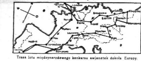
Trasa lotu międzynarodowego konkursu awionetek dokoła Europy.

Do zagadnień samorządowych powrócę na jednej z najbliższych konferencji, na którą zaproszę Panów po zapoznaniu się z ich całokształtem. Nawijając od tego, pobieżnego coprawda naszkicowa- nymi poszczególnych dziedzin pracy letących w tej chwili przed Urzędem Wojewódzkim i społecz- nictwem, podkreślam jeszcze, że pożądanym wyniki może być osiągnięty tylko wtedy, jeżeli zosta-