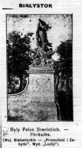
Były Pałac Branickich. — Herkules. (Woj. Białostockie — „Przeszło i Zabytki”. Wyd. „Lech”).

przyjemnością mogę podkreślić, że w ostatnim czasie w samym Białymstoku poszła ożyciać się pomalą przemysł wlokieniczy. Jako fakt podaję, że w ostatnim tygodniu znalazło zatrudnienie około 150 robotników w poszczególnych, drobnych moźe, ale w każdym razie odnawiających swe życie warsztatach. Rzeczą charakterystyczną i ujemną, którą zdołałem już dostrzec, jest fakt, że w niektórych zakładach przemysłowych robotnicy pracują ubroń ustanie nie przepisane osiem, lecz 12 i nawet 18 godzin. Utrudnia to niecierpliwą walkę z bezrobociem, zwiększa ilość bezrobotnych i nie pozwala skutecznie zmagać się ze skutkami kryzysu w przemyśle. Osobiście nie mogę dziwić się tym robotnikom, którzy w ten sposób poprzestają na swój byt, ale nie rozumiem przemysłowców, ustosunkowanych się w ten sposób do tak ważnego zagadnienia, jakim jest bezrobocie. Odpowiednie zarządzenia celem niedopuszczenia