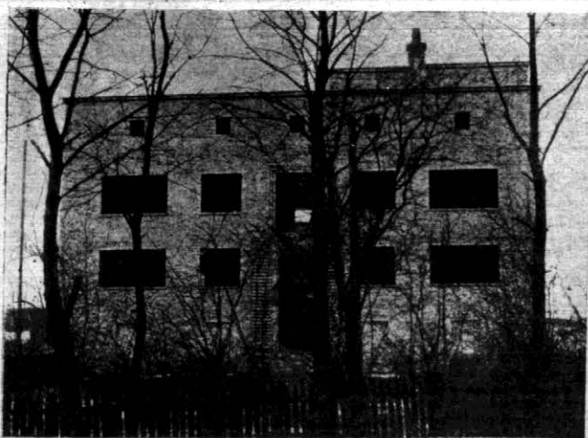
Front budującego się gmachu Kasy Chorych w Wołkowysku.

Gmach będzie posiadał pomieszczenia na aptekę, biuro zarządu, gabinety lekarskie i lecznicze, hotelik dla chorych z powiatu, kąpieliska, w