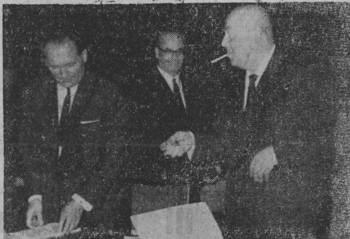
NA ZDJĘCIU: w przerwie obrad III Kongresu ZBoWiD J. Cyrankiewicz, E. Szyr i M. Moczar.

O problemach współpracy ZBoWiD z Liga Obrony Kraju mówił gen. bryg.